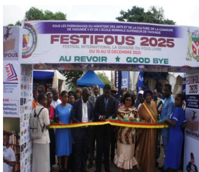
Coupure du ruban