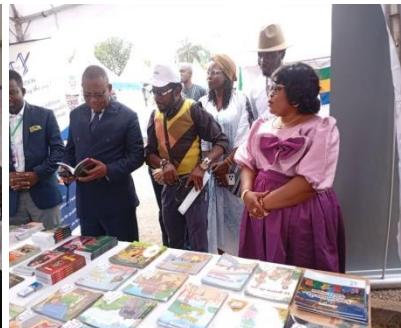
Quelques images de la visite des stands.