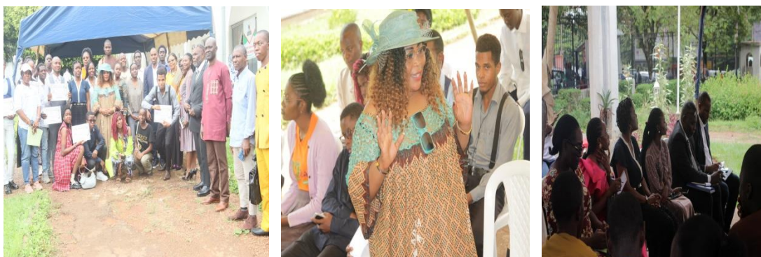
Célébration de la Journée Internationale de l'Enfant Africain, le 16 juin 2025 au Pôle des Arts Littéraires