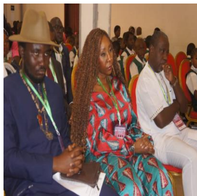
Cérémonie d'ouverture de la sixième édition du Festifous.