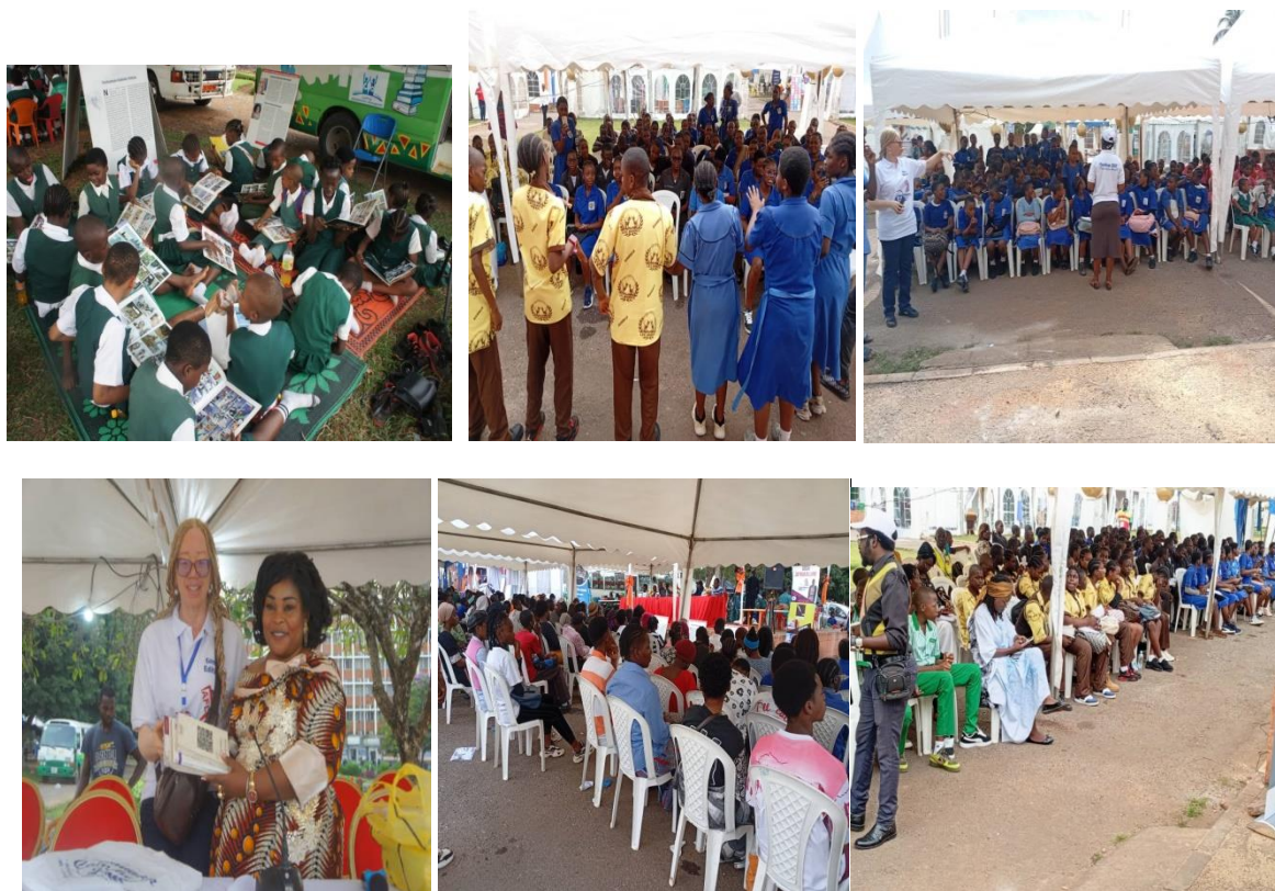
Quelques images de la finale des concours littéraires et conférences

Cette étude montre que les élèves de la ville ont plus de problèmes en littérature que ceux des zones rurales. Les fautes de contre sens sont en nombre considérable et la faute d'après nous revient à la propagation des réseaux sociaux. Nous pouvons conclure qu'il y'a beaucoup à faire encore sur le terrain et que le renforcement des capacités en milieu jeune a toute sa nécessité au vue des résultats escomptés.