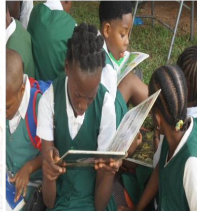
Quelques images des ateliers avec les élèves du primaire