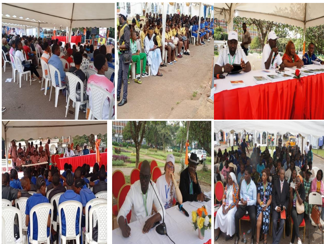
Quelques images des conférences-débats et tables rondes (Festifous2025)