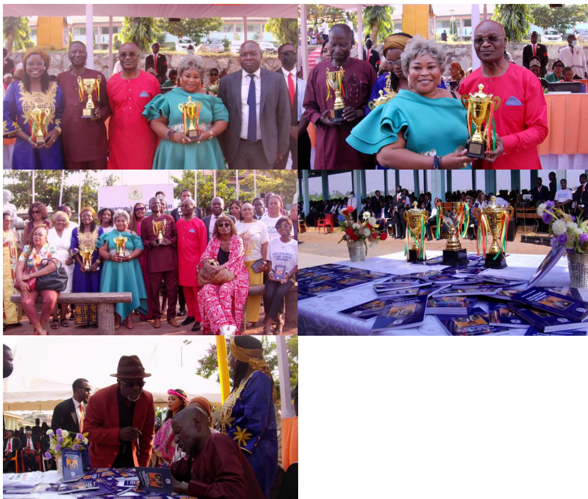
Quelques images de la cérémonie de dédicace et des récompenses à l'IAI-Cameroun