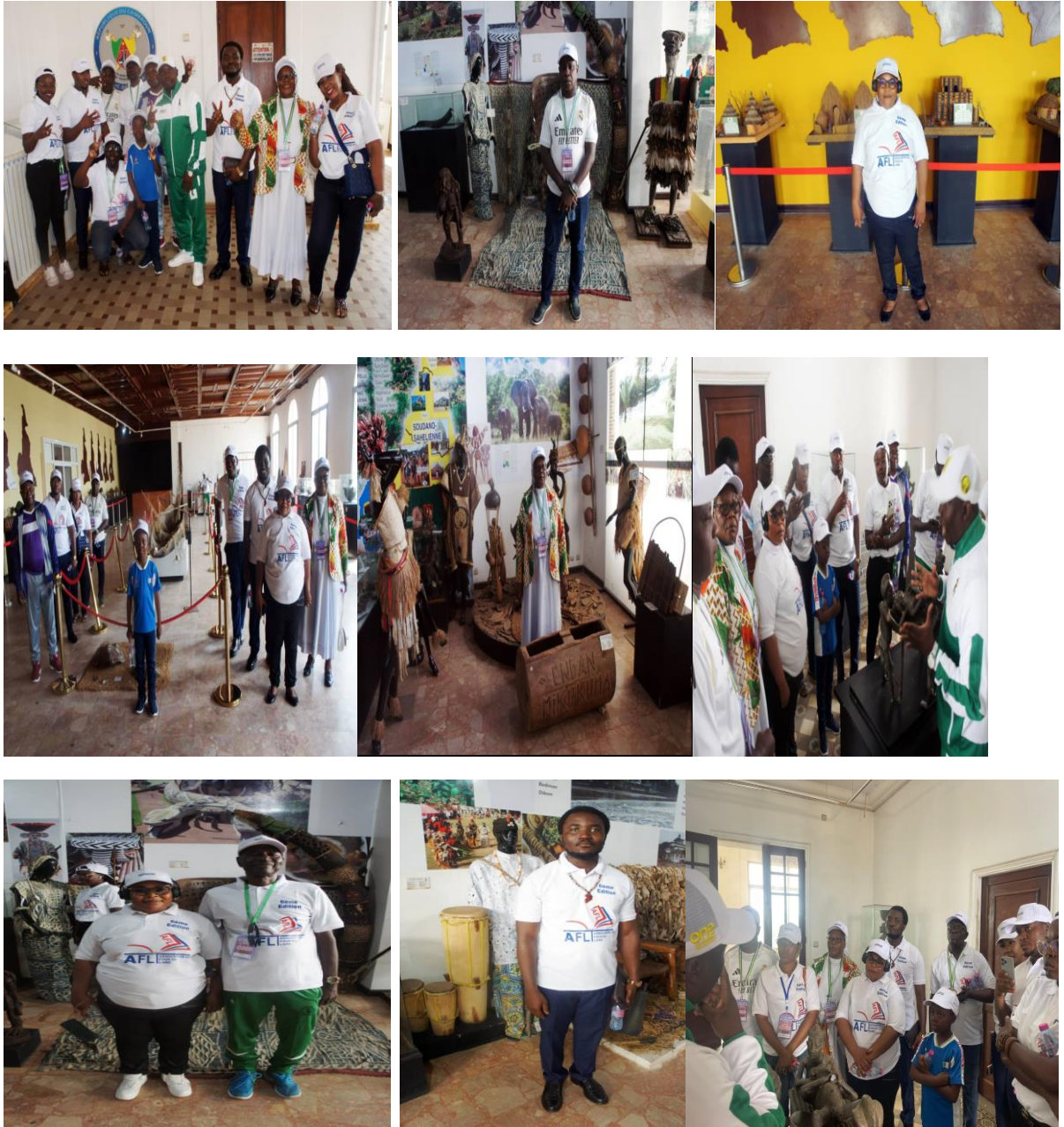
Quelques images de la visite du Musée National