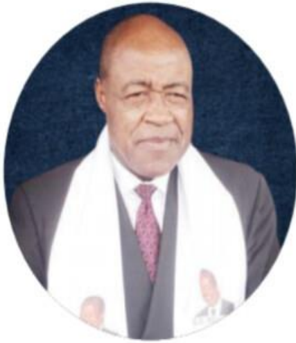
Dr. Pierre Ismaël BIDOUNG MKPATT

Ministre des Arts et de la Culture du Cameroun