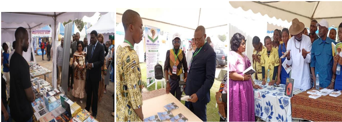
Quelques images du marché du livre