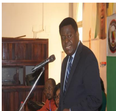
Représentant du MINAC