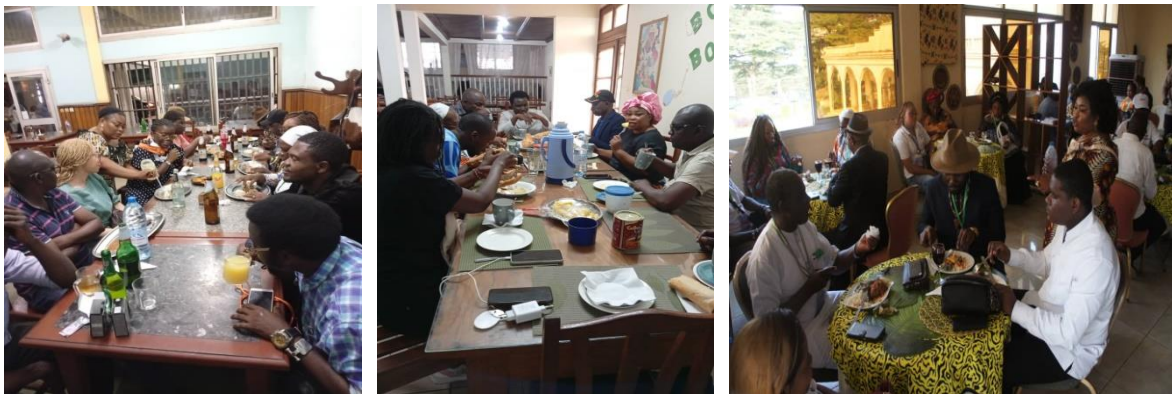
Quelques images des dîners avec les invités internationaux.

Les festivaliers depuis quelques années sont logés au même endroit à savoir à Mvolyé. Un comité d'accueil est mis en place à cette occasion pour accueillir les différents invités nationaux et internationaux pour plus de sécurité et pour une meilleure organisation. Un véhicule est mis à leur disposition et un protocole de qualité. Une cinquantaine de chambres mise à disposition pour les festivaliers désireux loger avec les invités officiels. Pendant leur séjour, ils sont pris en charge complètement par le Comité d'Organisation.