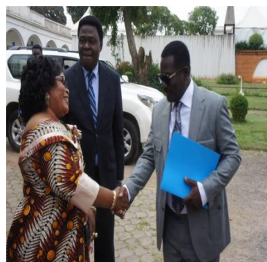
S.E.M Ambassadeur Gabon