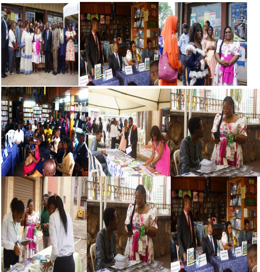
Quelques images de la Journée Mondiale du Livre célébrée à la Librairie des Peuples Noirs.