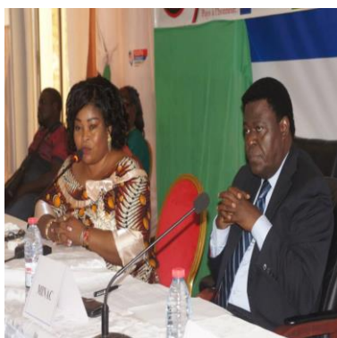
Discours de la PCO Festifous