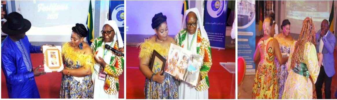
Quelques images de la soirée de gala du Festifous 2025